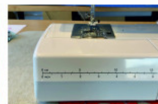
När du tar av tillbehörsasken har maskinen ett stödben som gör att maskinen står stadigt.

Se denna produkt på vår hemsida: http://pastellen.se/products/view/easy-jeans-1800